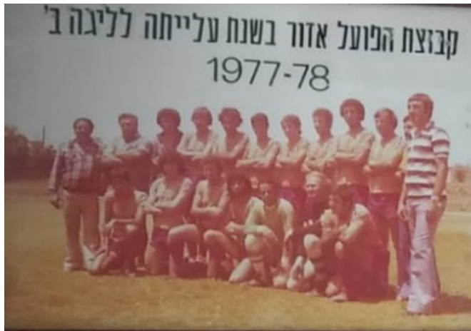
קבוצת הפועל אזור בשנת עלייתה לליגה ב'.